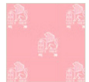
明神オリジナルピンク