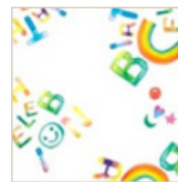
パースェレブレーション